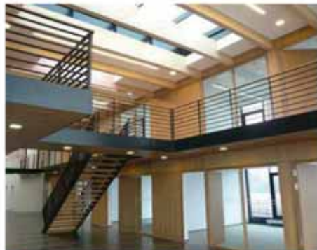
▲ Maritimes Forschungszentrum Eisfleht Atrium / Gesamter Innenausbau inkl. Türelemente und Wandverkleidungen