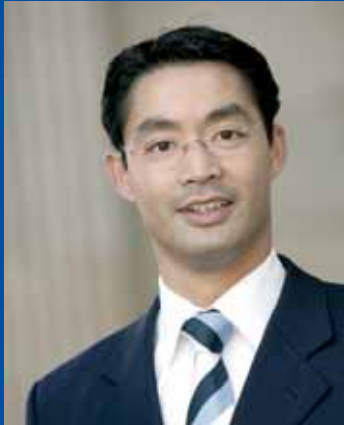
Dr. Philipp Rösler Wirtschaftsminister Niedersachsen

Das Handwerk ist der vielseitigste Wirtschaftsbereich Deutschlands und bildet mit seinen kleinen und mittleren Betrieben das Herzstück der deutschen Wirtschaft. Mit Flexibilität und Kreativität erfüllt es individuelle Wünsche seiner Kunden.