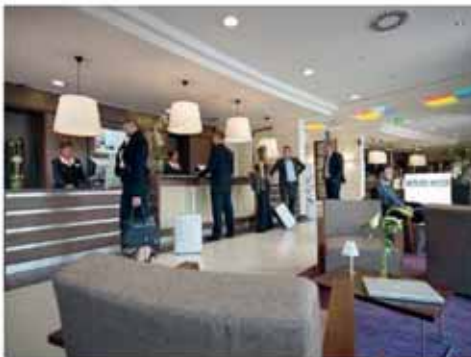
▲ Park Inn Hotel Papenburg Foyer / Empfangstresenanlage und Gastronomieeinrichtung

Objekteinrichtungen Innenausbau Fenster- und Treppenbau CNC Holztechnik